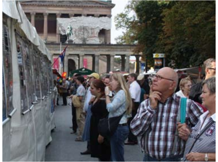
Tag der Mahnung 2010 Am Lustgarten. Links das Straßentheater von Calaca e. V.: »Invisibles – Menschen ohne Papiere«. Rechts: Besucher schauen sich die Ausstellung »Neofaschismus in Deutschland« an.